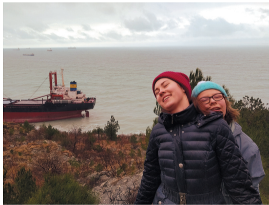
Уставшие, но счастливые. На заднем плане — севший на мель сухогруз RIO

В один из дней мы решили заехать в с. Кабардинка, чтобы посмотреть на сухогруз «RIO», севший на мель после сильного шторма в водах Черного моря в конце декабря 2018 г. Труден был наш путь к кораблю, но ни дождь, ни горы не смогли нас остановить. Сложности пути того стоили: перед нами предстал гигант-корабль с частью экипажа на палубе под флагом Того.