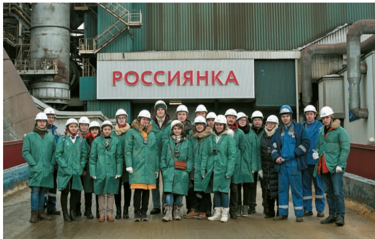
У доменной печи «Россиянка»

Наше исследование заключалось в изучении городских ландшафтов с позиций концепции урбогеосистем (УГС), разработанной коллективом кафедры в ходе прошлых экспедиций в г. Тюмень