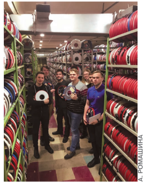
Центр хранения метеорологических данных, г. Обнинск

собрания, на которых открывается во всей красе исследовательский дух юных географов, посвятивших свои каникулы науке. Каждое собрание участники делились своими впечатлениями и наблюдениями, удивлялись и переживали, смеялись и думали, как же изменить что-то к лучшему. Для этого и существует истинная экспедиция, открывающая исследователям новые грани знакомых объектов и разжигающая в них интерес и желание к изучению проблем и поиска их решений.