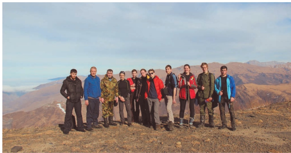
Восхождение на Данедук

Общение с местными жителями и представителями Итум-Калинской администрации подтвердило наши сомнения в пригодности мезоклимата склонов к развитию горнолыжного спорта на уровне всемирно известных альпийских курортов. Намного более перспективными представляются инициативы