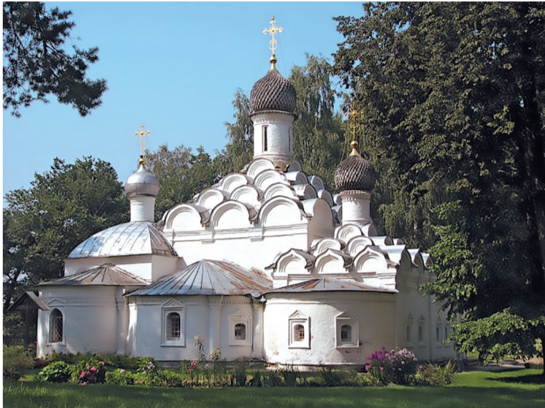
Храм Архангела Михаила, музей-усадьба Архангельское (Московская обл.)