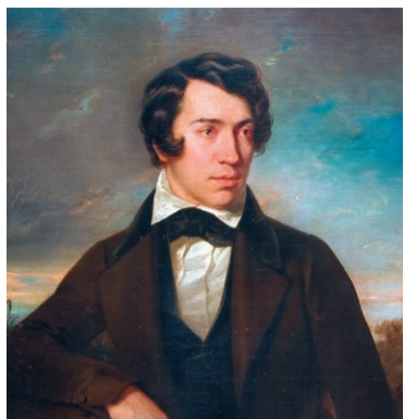
А.С. Хомяков. Неизвестный художник (Автопортрет ?). 1830-е. Музей-заповедник «Усадьба «Мураново» имени Ф.И. Тютчева