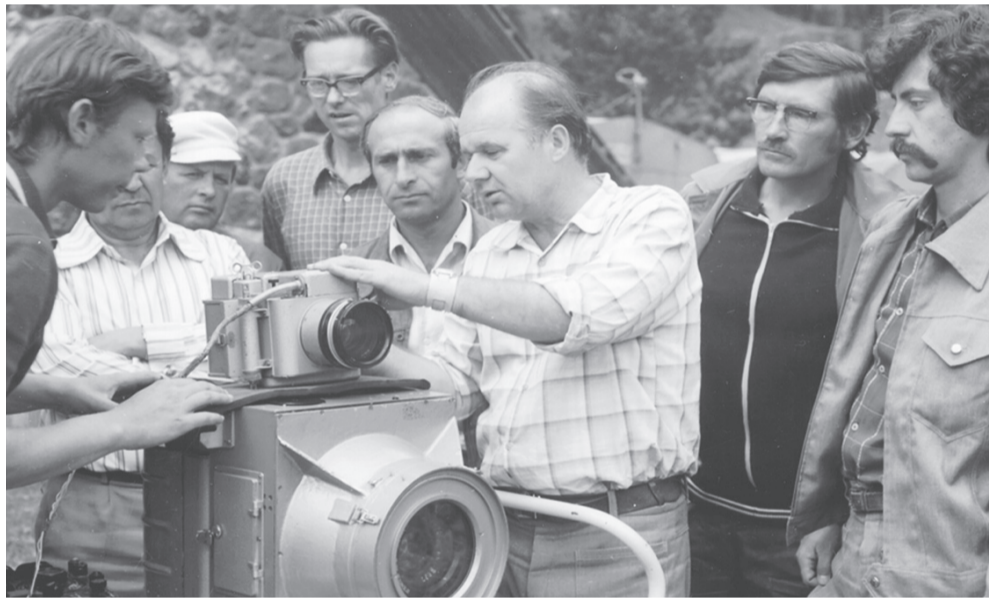
Полевая школа-семинар Межуниверситетского аэрокосмического центра в Приэльбрусье