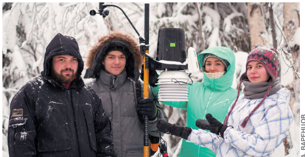
Установка AMC Davis