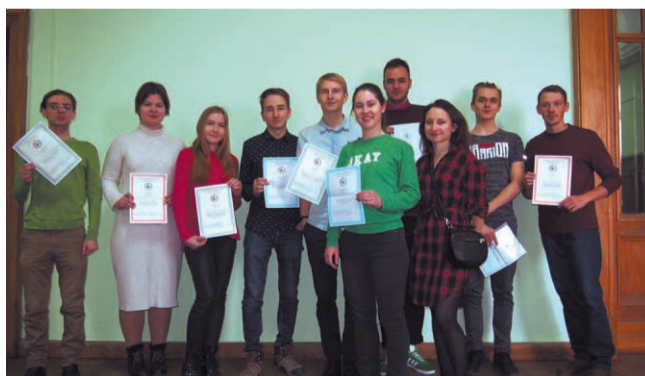
Дипломанты учебно-практического форума

В рамках этого значимого для факультета события студенты, магистранты и аспиранты-географы получают возможность обмениваться научной информацией по многим проблемам географии. Все интересующие их материалы участники форума находят в язычных источниках, а владение иностранным языком позволяет им попробовать свои силы в качестве докладчика, дает возможность делиться друг с другом опытом чтения зарубежной научной литературы и использовать полученные данные в своей дальнейшей исследовательской работе. Выступление с докладом перед заинтересованной аудиторией — это реальное применение иностранного языка на практике в процессе научного общения, обмена знаниями и приобретения навыков. Такой опыт публичного выступления с использованием наглядных и ярких презентаций, безусловно, будет полезен в будущем всем участникам форума.