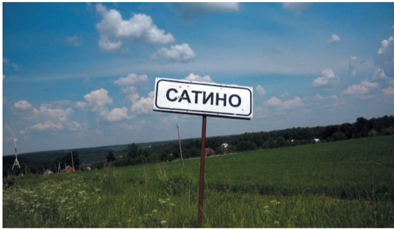
Сатино без заборов. Застроенная ныне часть Бутовского холма у пирамиды Придорожной, 2006 г.

В прошлом году, наряду с 80-летним юбилеем географического факультета МГУ, отмечалась еще одна связанная с ним дата — 50-летие Сатинской учебной практики, Сатинской учебно-научной станции, Сатинского учебного полигона (см. Geograph №№ 42–43, 2018). Возникшие на тридцатом году существования географического факультета, они давно уже стали его основой, фундаментом, неотъемлемой частью. Более десяти тысяч географов МГУ имеют за плечами «сатинскую школу», многие из них стали видными учеными, администраторами, общественными деятелями. Более половины нынешних заведующих кафедрами географического факультета прошли через это учебное мероприятие в долине р. Протвы.