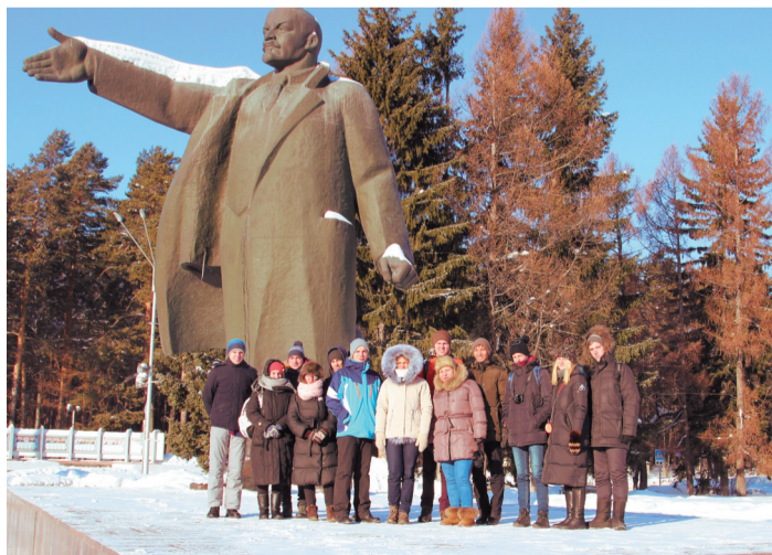
Команда кафедры в г. Северске

Особое впечатление во время экспедиции произвело посещение наукограда Кольцово, где мы обнаружили и умные светофоры с фотоэлементами, и велодорожки, очищенные от снега, и большой муниципальный парк с инфраструктурой для горнолыжного спорта и активного отдыха. Также на территории Кольцово действует биотехнопарк и научный центр «Вектор». Оказывается, качественной городской среды можно добиться и в Сибири при температуре ниже -40^{\circ}\text{C} . Несомненно, Кольцово останется в памяти надолго как одно из самых интересных мест, посещенных мной.