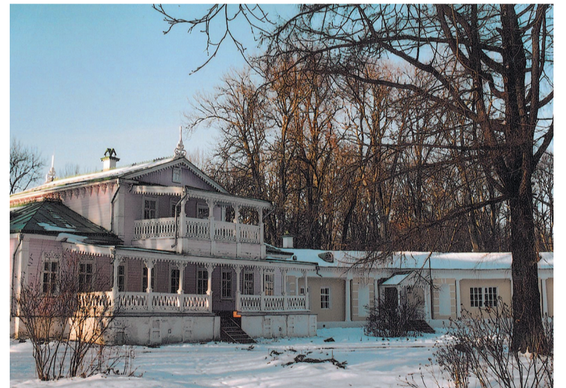
Усадьба Спасское-Лутовиново — музей-заповедник И.С. Тургенева (Орловская обл.)

Печальна участь усадебно-парковых комплексов. Исчезли сословия, которые обустроили усадебную жизнь, и возродить их сегодня не представляется возможным. Но изучать и сохранять наследие усадебной культуры — наш патриотический долг и одна из частей той национальной идеи, над формулировкой которой ломают головы политики.