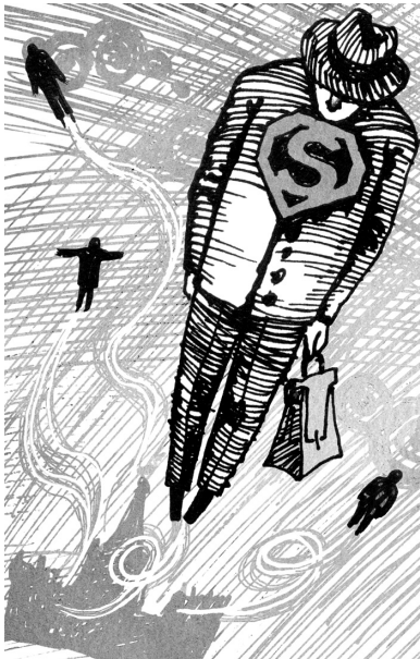
Пессимист скажет: «Нас мало», а оптимист: «Мы элита». Автор неизвестен