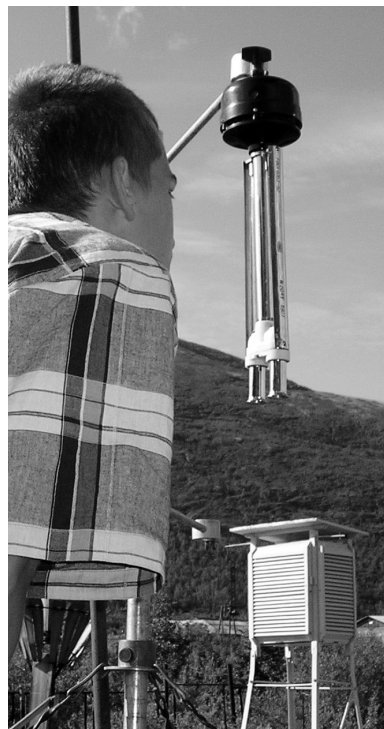
Наблюдения — материал исследований

В России система гидрометеорологического образования имеет три ступени: высшее, среднеспециальное и начальное образование. Для реализации высшего образования организованы гидрометеорологические университеты (Санкт-Петербург, Владивосток), кафедры географических факультетов в вузах (МГУ, СПбГУ, КГУ, ЮУГУ и т. д.), кафедры гидрометеорологического обеспечения в военных вузах. Среднеспециальное