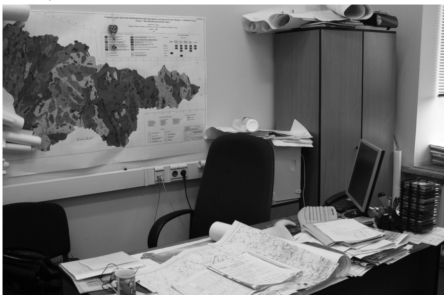
«Если студенты работают так же, как веселятся, то я спокоен за современную науку» (Нильс Бор)

Завершается мое обучение на географическом факультете. Осталось совсем немного — чуть больше года. Затем начнется другая жизнь, по-настоящему самостоятельная и уже не такая веселая. Резонен вопрос: «Что дальше?» Скоро я стану дипломированным специалистом, но что я буду делать с этим по жизни? Мои друзья и знакомые из других университетов, из родного города, даже случайные попутчики постоянно спрашивают меня о планах. И когда узнают о моей будущей профессии, интерес лишь возрастает.