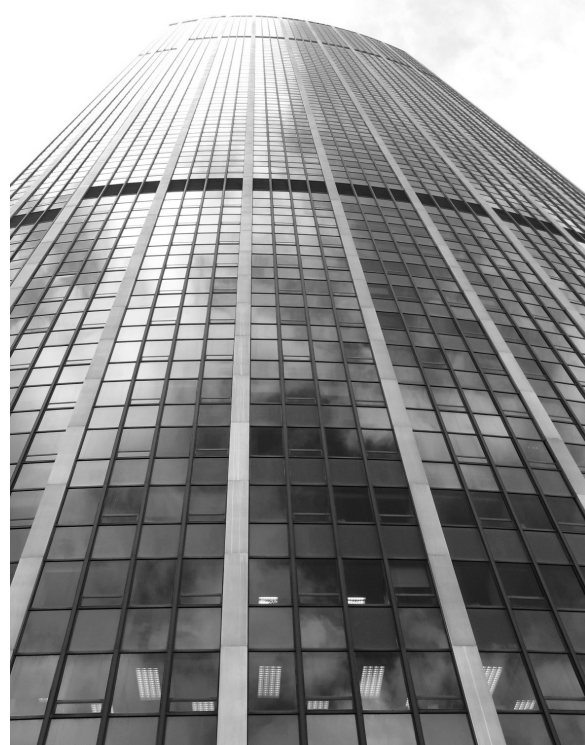
Ваша работа — ваш выбор

Специфика работы над проектами в сфере недвижимости заключается в требовании наличия знаний из области ряда дисциплин, не изучаемых на экономгеографических кафедрах геофака, но активно используемых в работе. Для полноценного участия в работе над бизнес-планом проекта полезными будут знания основ финансового анализа, строительного дела и архитектуры. Как правило, их наличие не является определяющим при приеме на работу. Поэтому аналитики и консультанты, имеющие экономико-географическое образование, овладевают ими уже в процессе работы.