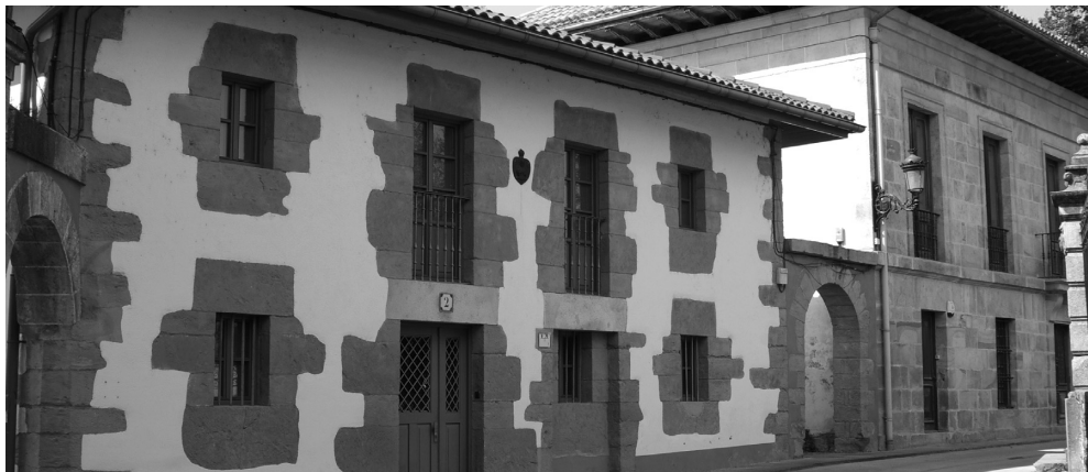
Типичная архитектура города Герника