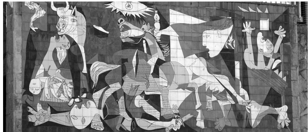
Копия картины П. Пикассо «Герника» в городе Герника