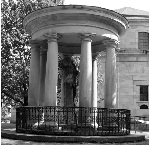
Ствол старого дуба, 2007 г.

Баски... Кто они? Народ, который пытается добиться мирового признания путем насилия? Или же они — национальное меньшинство, которое борется за соблюдение по отношению к ним основных прав и свобод?