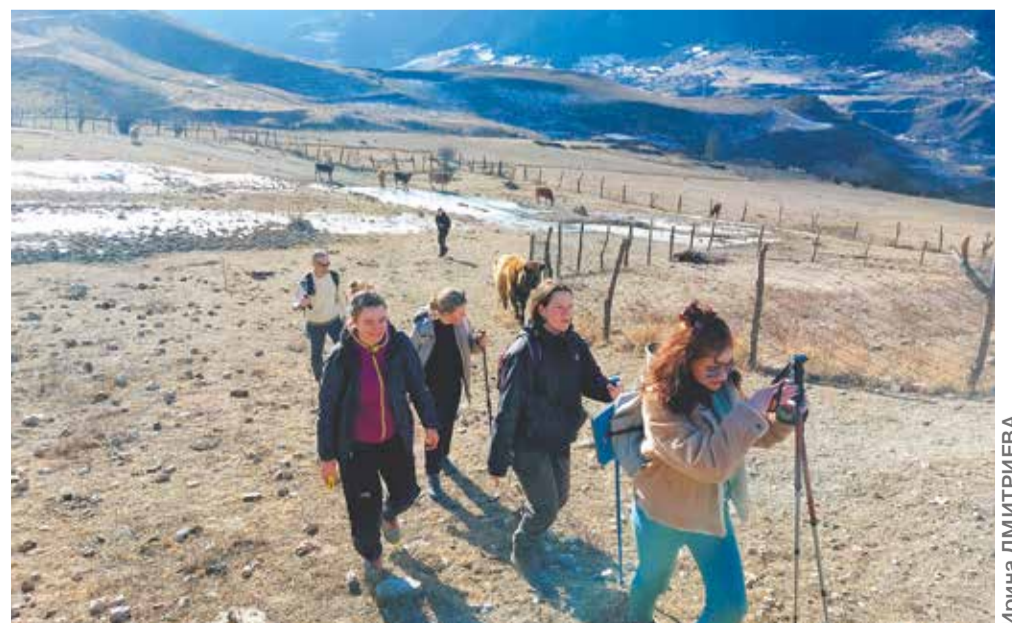
Наперегонки с осетинскими коровами к руинам Ханазы

Отдельные исследования были посвящены оценке эстетических свойств пейзажей Горной Дигории. Многоплановость, наличие сложных линий горизонтов вдоль горных вершин и гребней, согласованность контуров хребтов с ареалами луговой, хвойной и мелколиственной растительности, а также с историко-архитектурными объектами придают этим местам неповторимый облик. Нам удалось оценить эти особенности не только визуально, но и с помощью структурно-информационного анализа. Результаты оказались вполне очевидными: эстетика местных пейзажей уникальна и требует отдельного внимания.