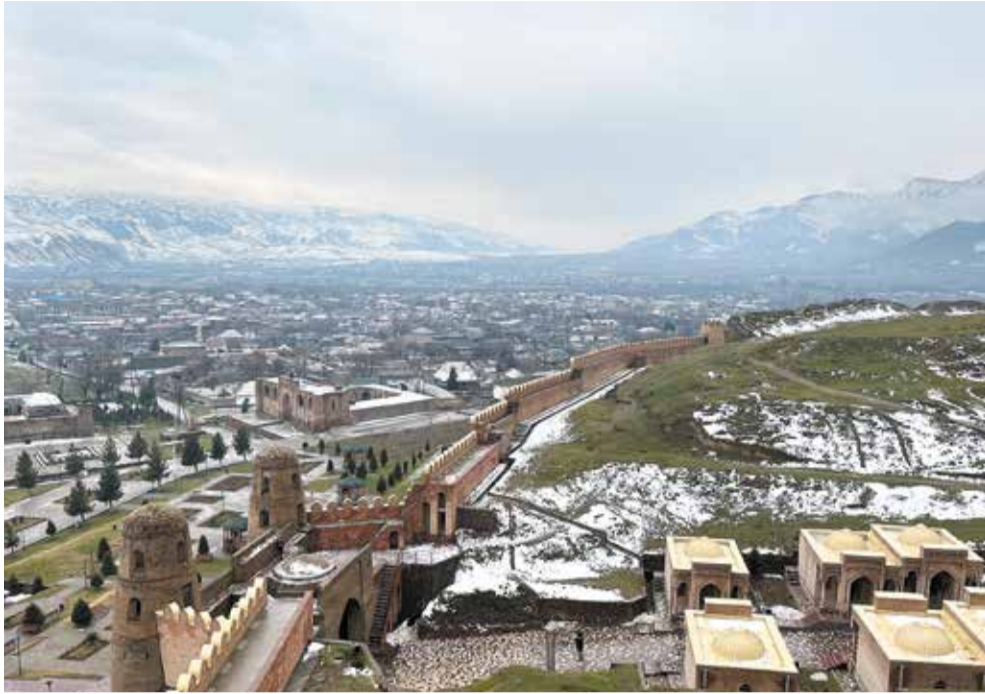
Гиссарская крепость — историко-культурный памятник в Таджикистане возрастом около 2500 лет