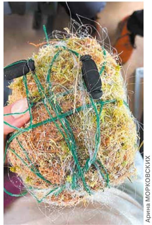
«Ежи» из мха сфагнума — биоиндикатор загрязнения атмосферного воздуха

Я получил наслаждение от экспедиции. Несмотря на то, что я океанолог, меня приняли как родного, так что я быстро влился в коллектив. Проведенные исследования увлекли меня, я с удовольствием участвовал во всех процессах. Мы отбирали пробы снега, хвои, проводили соцопросы, а также «плавали» в сугробах (ведь океанолог везде найдет место для купания!). Огромное спасибо преподавателям за теплый прием, а ребятам за проведенное вместе время. Уверен, это не последнее мое свидание с РПП.