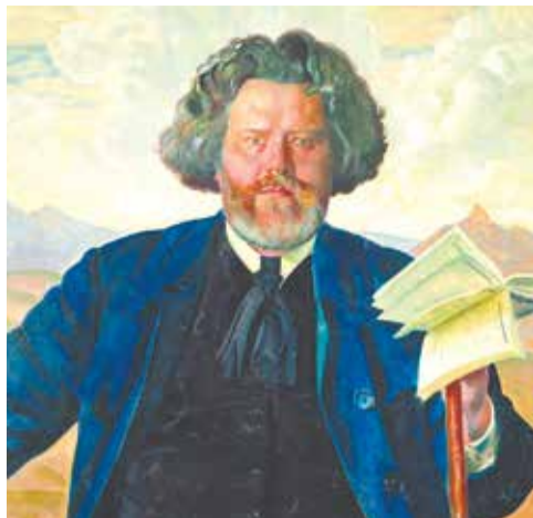
Портрет кисти Бориса КУСТОДИЕВА, 1924 г.