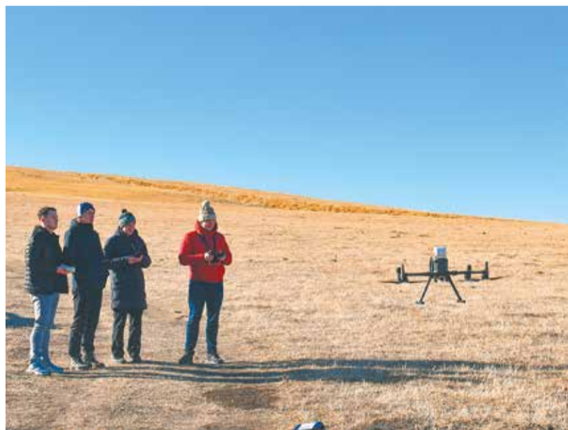
«Мы делили апельсин»: много нас, а дрон — один

В первый же день исследований часть нашей компании поехала на высокогорную научную станцию ИФА на плато Шаджатмаз устанавливать приборы и проводить измерения. Путь к станции проходил через прекрасные горные территории Кавказа с ущельями, перевалами и хребтами. Так как снега почти не было, вся местность представляла собой удивительный оголенный ландшафт, с виду напоминающий марсианские пустыри. Во время пути мы пересекли границу двух регионов России — Ставропольского края и Карачаево-Черкесской Республики около села Кичи-Балык.