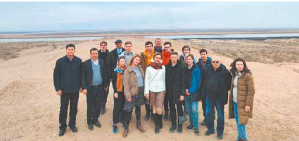
В древнем городе Кара-Тепе на границе с Афганистаном

Некоторые участники экспедиции были в Средней Азии впервые, а кто-то бывал уже неоднократно. Интересно сравнить взгляд