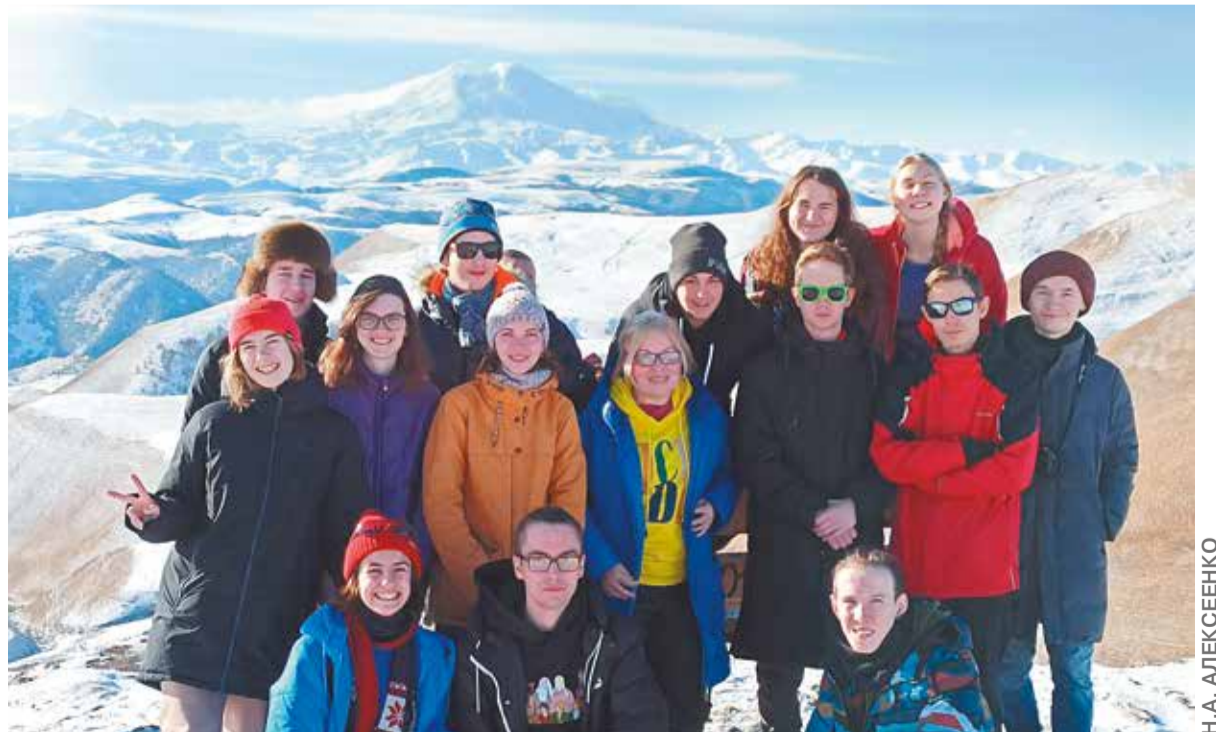
Картографы-волонтеры на смотровой площадке с видом на Эльбрус

На следующий день студентов ожидало «боевое крещение» — первый поход на участки проведения основных работ и осуществления измерений, которые должны будут лечь в основу научных работ, написанных по итогам выезда. Участки располагались в лесопосадках неподалеку от Кисловодска. Путь к ним, длиной 8 километров в одну сторону, занимал около полутора-двух часов пешего хода и проходил по пересеченной местности, где даже встречались резкие стометровые подъемы. Иногда приходилось останавливаться, чтобы перевести дух, но вокруг были такие чарующие виды, что каждая остановка для отдыха превращалась