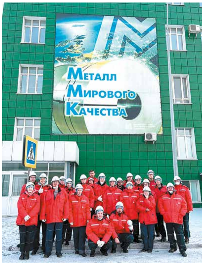
Экскурсия на Магнитогорский металлургический комбинат

Р. S. Все участники выражают благодарность кафедре гидрологии суши за организацию интересных полевых исследований.