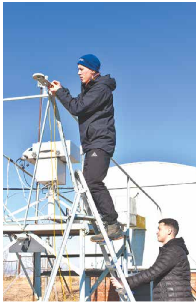
Установка балансомера Kipp & Zonnep на плато Шаджатмаз