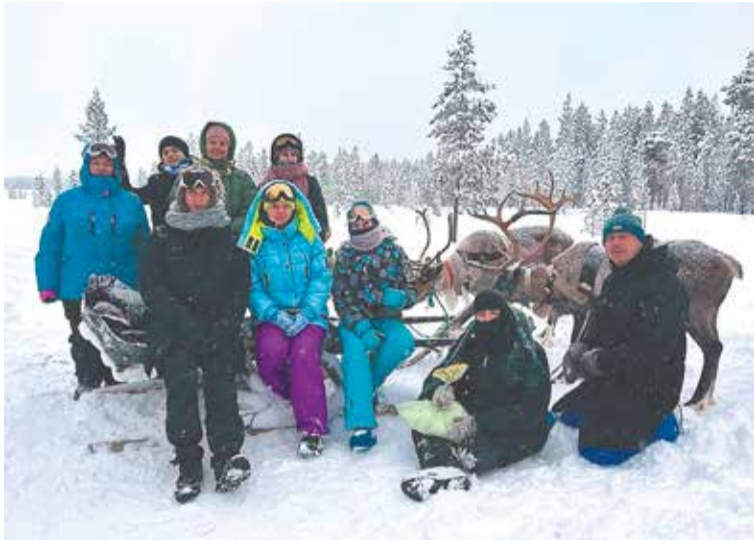
В гостях у ловозерских оленеводов

Как может быть, чтоб мерзлый пар Среди зимы рождал пожар? М. В. Ломоносов